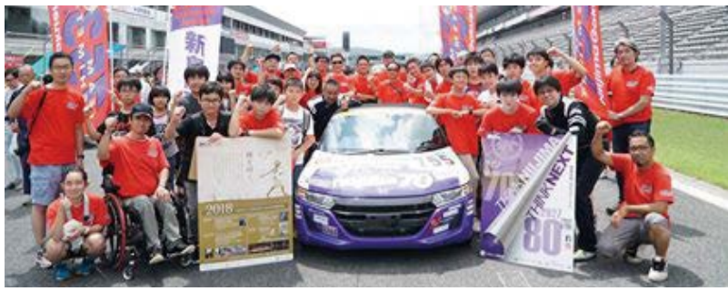
2018年度新島学園オートキャラバン隊プロジェクト/ 753太ゼミ: Automobile at K4-GP 2018 FUJI 500km