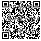
QRコード (新島学園 YouTubeチャンネル)