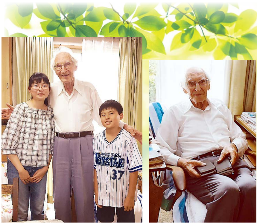
お孫さん二人に囲まれて